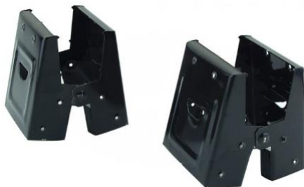
SOPORTES DE CABALLO (PLEGABLES)

• En lugar de utilizar mesas plegables / para banquetes estándar que son demasiado altas para muchos participantes, considere la posibilidad de hacer sus propios caballetes cortos. ¡Serán económicos, fáciles de mover y fáciles de almacenar!